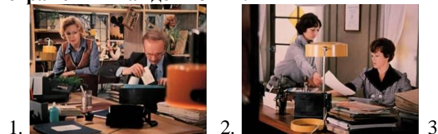
1. 2. 3.

Задание 7. Посмотрите Фрагмент 6 «Заявление» (к/ф «Служебный роман»), расставьте картинки в нужном порядке и расскажите, какие действия персонажей отражены в каждой из них.