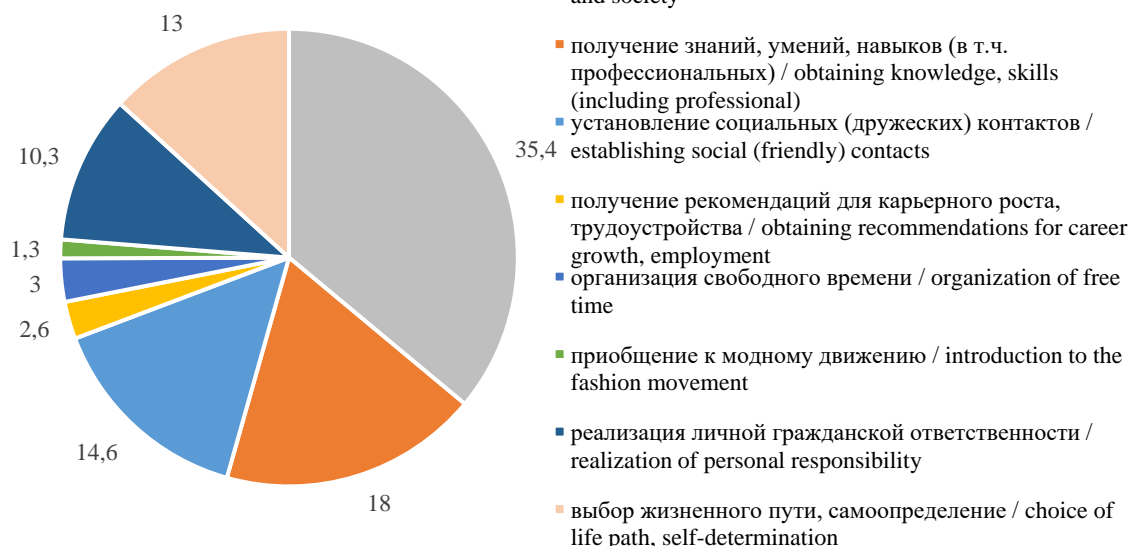
Рис. 2. Ценности волонтерского труда Fig. 2. The values of volunteer work

Не менее информативны и интерпретации самого понятия «волонтерства», в которых также прослеживается ценностное содержание (рис. 2). Всероссийский онлайн-опрос волонтеров, показал, что для более чем трети опрошенных волонтерство – это в первую очередь возможность быть полезным обществу и государству. Для каждого десятого это еще и способ реализовать чувство гражданской ответственности за происходящее. Хотя в целом по выборке доля тех, кто сочетает собственные интересы (расширяя круг общения, пространство досуга, компетенции и т.д.) с общественными превышает предыдущие показатели и суммарно составляет абсолютное большинство (51,2%). Такие ценностные трансформации К. Бидерман назвал «переходом альтруистической помощи в добровольную убежденную активность» (Бидерман, 1999: 41).