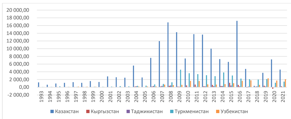
Рис. 3. Динамика инвестиций в страны ЦА, млн.долл.

Страны Центральной Азии сегодня развиваются очень быстро, прогнозируется рост ВВП в 2023 году в среднем по региону превышающий 6%, однако это развитие – следствие эффектов низкой базы, а также активного притока инвестиций из стран-основных игроков в регионе. Обратим внимание на рисунок 3, отражающий динамику ПИИ в ЦА в целом.