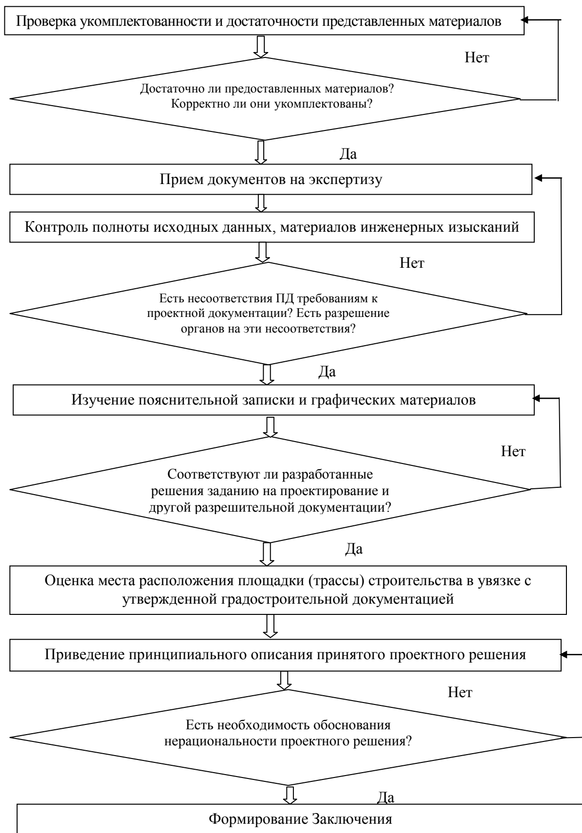
Рис. 1. Алгоритм проведения негосударственной экспертизы проектной документации