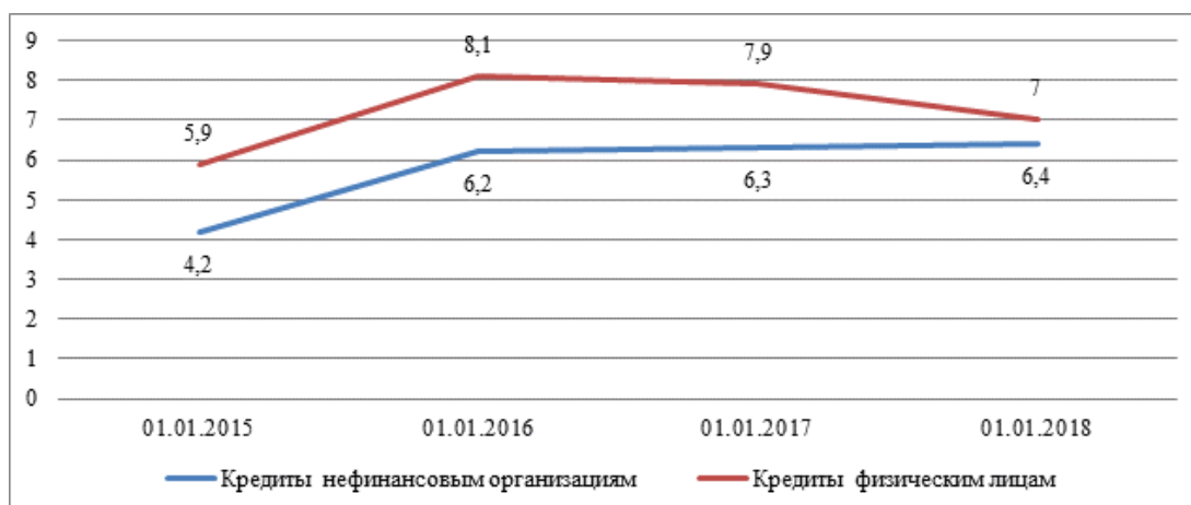
Рис. 4. Доля просроченной задолженности в кредитах и прочих средствах нефинансовым организациям и физическим лицам