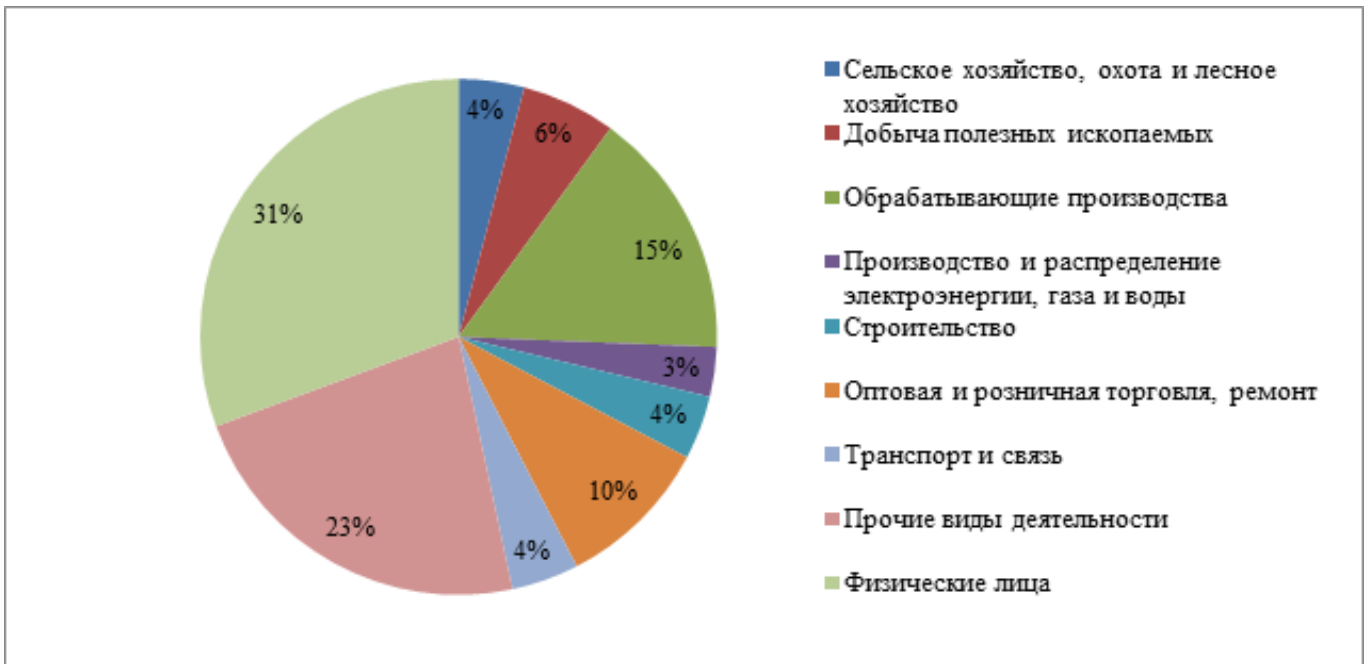
Рис. 2. Структура задолженности по кредитам, предоставленным кредитными организациями на 01.01.2018, в %

Доля проблемных и безнадежных ссуд в общем объеме ссуд на начало 2017 года увеличилась на 8% по сравнению с 2016 годом и составила 9,4%. К 2018 году данный показатель составил 10%. Однако, отношение совокупной величины крупных кредитных рисков к капиталу с 2016 года уменьшилось на 14%, что может свидетельствовать о сокращении крупных кредитных рисков.