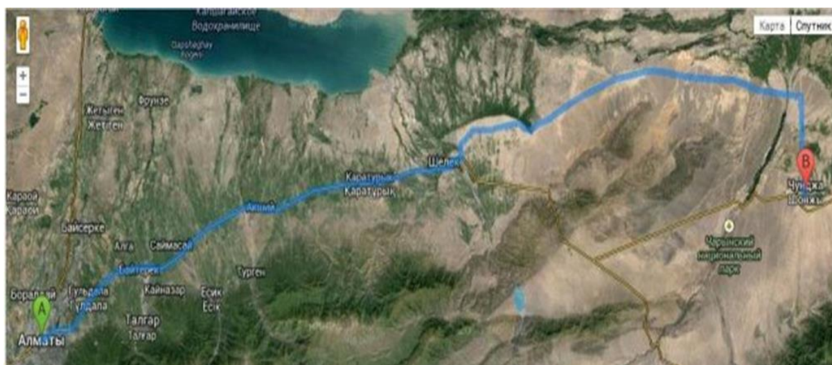
Рис. 2. Дислокация территории Арасанов Шонжы Уйгурского района Алматинской области Fig. 2. The deployment site Arsanov of Songy Uighur district of Almaty region

Эта территория имеет название Арасаны, или горячие источники Шонжы, по названию районного центра Уйгурского административного района села Шонжа. Территория района и Арасанов расположена в юго-восточной части Алматинской области, вдоль автомобильной трассы республиканского значения Шонжы – Кольжат (по обеим ее сторонам), что определяет доступность зон отдыха для отдыхающих и туристов. Использование территории и горячих источников для отдыха и рекреации началось еще в прошлом веке местными жителями, которые интуитивно использовали воду для лечения болезней желудочно-кишечного тракта, почек, дерматологических заболеваний, а также для общего эмоционального восстановления организма. Лечение проводилось без назначений врача и на бессистемной основе.