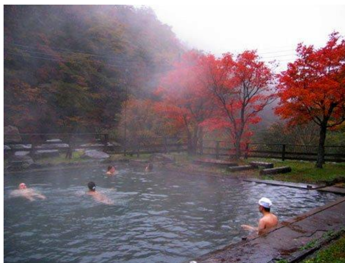
Рис.3. Зоны отдыха Арасан Уйгурского района Алматинской области Fig. 3. Recreation areas of Arasan Uygur district of Almaty region

Каждая зона отдыха имеет свой подъезд и открытую автомобильную стоянку внутри территории. Территории огорожены и озеленены. Основной вид рекреации – пассивный отдых. Большинство зон отдыха предлагают отдыхающим выезд к ближайшим природным достопримечательностям (Чарынский каньон, Ясенева роща и др.). Также можно посетить Бартогайское водохранилище. В единичных случаях предлагается рыбалка и езда на квадроциклах.