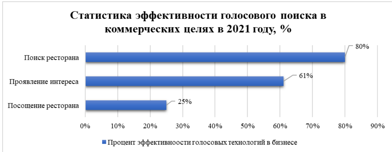
Рис. 1. Статистика эффективности голосового поиска в коммерческих целях в 2021 году, % Fig. 1. Statistics on the effectiveness of voice search for commercial purposes in 2021, %

Данная тенденция роста голосовых технологий показывает, насколько речевые технологии – уже являются частью нашей жизни. По статистике 2021 года, использование населением устройств, которые поддерживают голосовую связь, постоянно растет (см. рис. 2) [4, 9]. Можно считать, что произошла «голосовая революция».