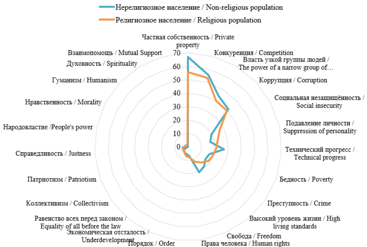
Рис. 2. Структура мнений респондентов типологических групп о том, что означает для них понятие «капитализм», в %