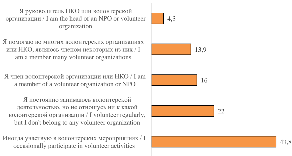
Рисунок 1. Ответы респондентов на вопрос: «К какой группе Вы могли бы себя отнести?», %