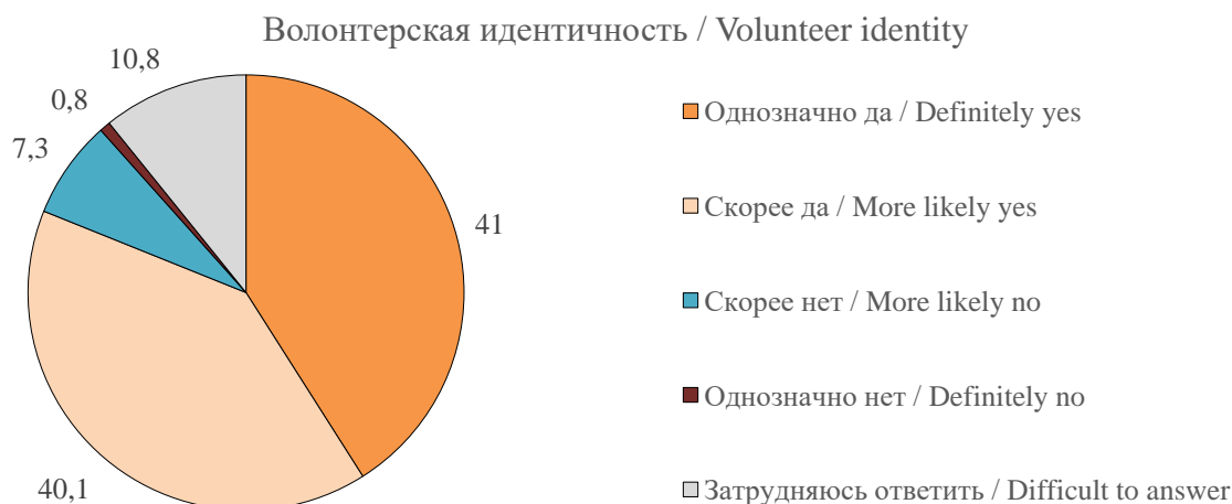
Рисунок 4. Ответы респондентов на вопрос: «Как Вы считаете, можно ли Вас назвать волонтером (добровольцем)»?», %