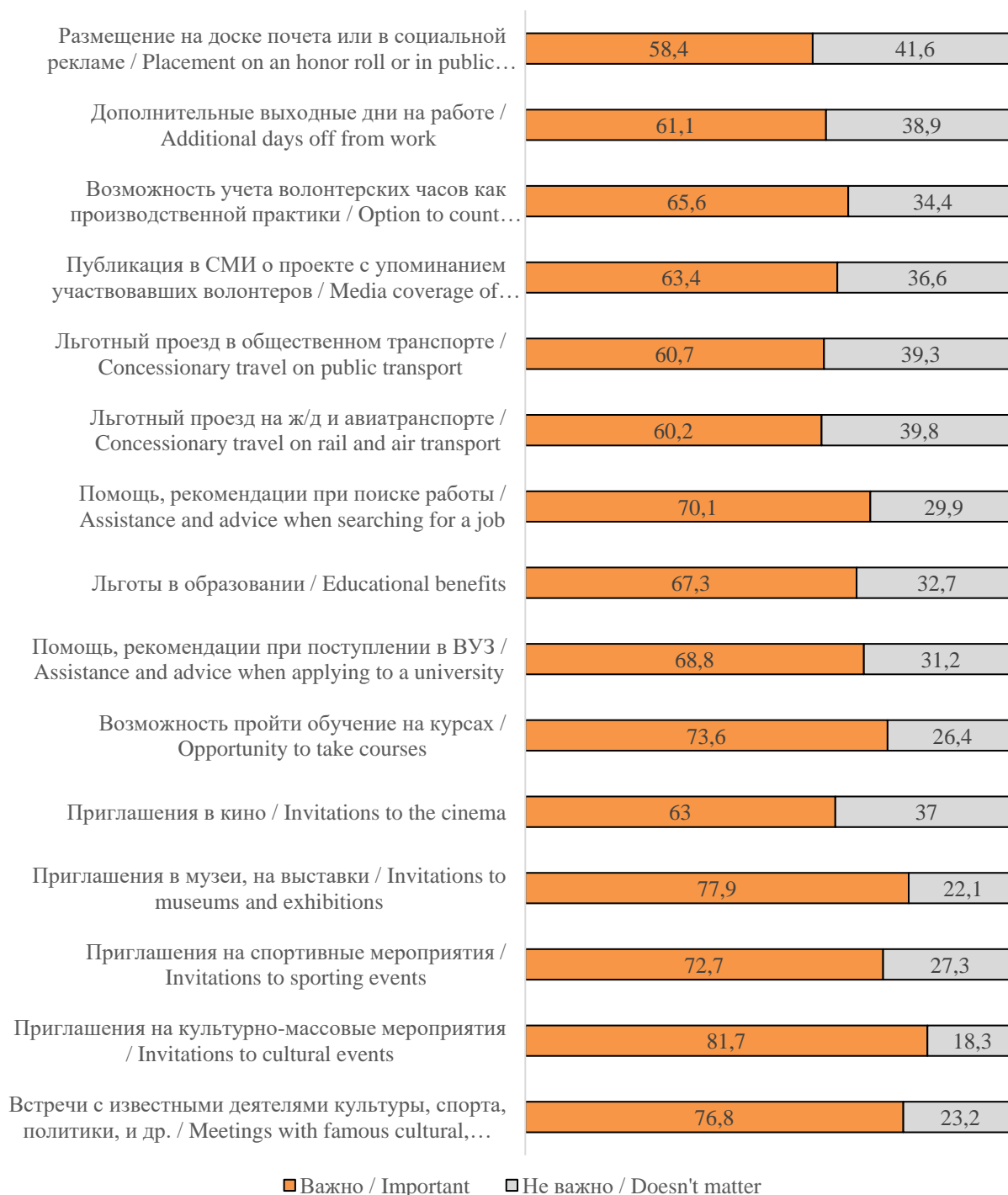
Рисунок 4. Ответы респондентов на вопрос: «Как Вы считаете, какие способы поощрения важны для таких волонтеров, как Вы?», % Figure 4. Respondents' answers to the question: "What types of rewards do you think are important for volunteers like you?", %

Второй уровень представлен смешанной группой, где доминируют инвестиционные формы (обучение,